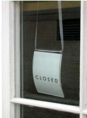
„Closed“ - am Feiertag bleibt das Geschäft geschlossen!

Holiday heißt nämlich übersetzt „heiliger Tag“ (holy day). Die meisten der amerikanischen Feiertage sind jedoch gar nicht heilig. Viele Festtage erinnern an große Ereignisse der amerikanischen Geschichte oder an berühmte Personen.