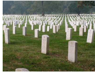
Auch auf dem Soldatenfriedhof in Arlington gedenkt man am 11. November der Gefallenen!

Am 11. November 1918 ging der Erste Weltkrieg zu Ende und die Soldaten legten die Waffen nieder. Bis heute wird dieser Tag in den USA gefeiert. Heute gedenkt man der Soldaten und Soldatinnen, die für die USA in den Krieg gezogen sind und gekämpft haben.