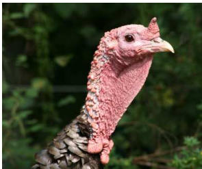
Der Truthahn steht an Thanksgiving auf der Speisekarte!

Thanksgiving ist in Amerika nicht nur ein Feiertag, sondern eigentlich ein Feierwochenende . Viele Menschen nehmen sich den Freitag frei und fahren für ein langes Wochenende nach Hause zu ihren Familien.