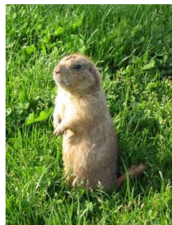
Es gibt sogar einen Feiertag, der dem Marmelotier gewidmet ist: Groundhog Day am 2. Februar!

In den USA gibt es hunderte von Religionen und viele verschiedene Nationalitäten und Kulturen. Jede Gruppe feiert ihre eigenen Feiertage. So haben zum Beispiel die Iren den St. Patrick's Day , den sie am 17. März in grüner Kleidung feiern. Am 5. Mai gehen die Mexikaner auf die Straße und feiern ein buntes Cinco de Mayo -Fest. Viele Afro-Amerikaner feiern nicht Weihnachten sondern Kwanzaa - ein Fest, das vom 26. Dezember bis zum 1. Januar dauert.