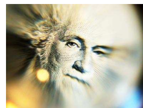
Washington ist auch auf der Dollarnote zu sehen.

Der allererste Präsident der Vereinigten Staaten war George Washington . Er regierte das Land von 1789 bis 1797. Sein Gesicht ist auf der 1-Dollar-Banknote abgedruckt und ihm zu Ehren gibt es einen Feiertag. Der dritte Montag im Februar ist eigentlich ihm gewidmet. Inzwischen feiert man an diesem Tag jedoch nicht mehr nur Präsident Washington sondern alle Präsidenten.