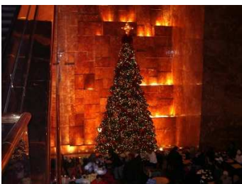
Hauptsache es glitzert! Geschmückter Weihnachtsbaum in New York City!

Weihnachten ist eine leuchtende Sache in den USA: Die Menschen hängen gerne viele Lichterketten an ihre Balkone, Fenster und in die Gärten. Der amerikanische Weihnachtsmann heißt „ Santa Claus “ und soll angeblich am Nordpol wohnen. Während des Jahres überwacht er dort anscheinend die Herstellung und Verpackung der Weihnachtsgeschenke. Man sagt, dass er frühmorgens am 25. Dezember auf seinem Schlitten, der von Rentieren gezogen wird, angefliegen kommt. Er rutscht durch den Kamin und füllt die aufgehängten Strümpfe der Kinder mit Geschenken .