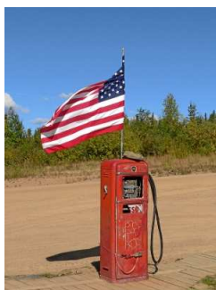
Am 4. Juli hängen überall Fahnen!

Am 4. Juli haben die Vereinigten Staaten Geburtstag! Also nicht alle 290 Millionen Einwohner, sondern das Land! Am 4. Juli 1776 wurde nämlich die so genannte Unabhängigkeitserklärung unterschrieben und somit waren die USA als eigenständiges Land „geboren“. Damals gab es nur 13 Staaten, die eigentlich noch unter der Macht des britischen Königs standen. Die Staaten führten gegen den König Krieg und machten sich mit der Erklärung unabhängig von ihm. Dieser Geburtstag wird überall in den USA mit Picknicks, Feuerwerken und Grillparties gefeiert.