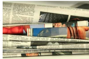
Lieber noch mal in die Zeitung schauen, ob wirklich schulfrei ist!

Viele von ihnen sind an einem Montag - das ist praktisch, denn dann hat man gleich ein langes Wochenende! Trotzdem sind auch die Amerikaner oft verwirrt, an welchem Feiertag die Geschäfte und Schulen geschlossen bleiben und an welchem nicht. Oft schauen sie lieber noch mal in die Zeitung (newspaper), um auch ganz sicher zu gehen!