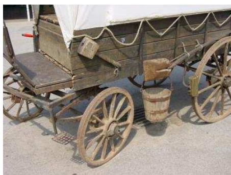
Solche Kutschen waren lange Zeit das einzige Transportmittel in den USA!

1789 wurde beschlossen, wie die Wahl eines Präsidenten in den USA abzulaufen hat. Damals gab es kein Telefon, kein Auto und natürlich kein Internet. Die Menschen reisten - wenn überhaupt - mit Kutschen durch das Land und auch die Post musste per Pferd verschickt werden.