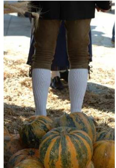
Der Wahltermin sollte nicht in die Erntezeit fallen!

Am Ersten des Monats fanden früher immer die Prozesse bei Gericht statt. Damit auch Richter, Angeklagte, Anwälte und Zeugen zur Wahl gehen konnten, hat man sich diesen komplizierten Wahltermin ausgedacht, der nie auf einen Monatsersten fallen konnte.