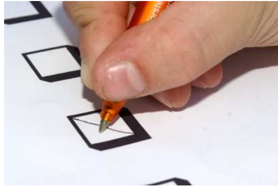
Wo würdest du dein Kreuzchen machen?

Aber selbst wenn du ein erwachsener Amerikaner wärst, würdest du nicht direkt Obama oder McCain wählen, sondern einen so genannten Wahlmann ! Die Wahlen in den USA sind nämlich indirekt: Man wählt also nicht direkt einen Kandidaten, sondern einen Wahlmann. Dieser Wahlmann verspricht bei der eigentlichen Wahl, die dann im Dezember stattfindet, für den einen oder den anderen Kandidaten zu stimmen.