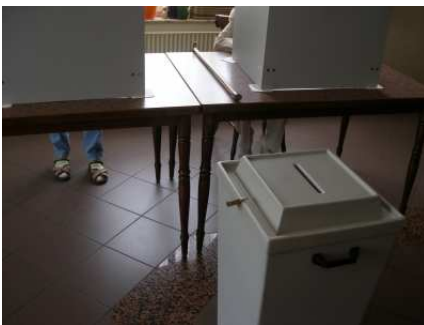
Eine ganz klassische Wahlkabine mit Urne!

In den USA gibt es 50 Staaten und fast genau so viele Arten, einen Wahlschein auszufüllen. Wie man nämlich genau wählt, das ist die Sache des einzelnen Bundesstaates. Einen Bundesstaat kann man ein bisschen mit einem Bundesland in Deutschland vergleichen. Die Regierung von Florida hat sich die „Stanzmethode“ ausgedacht: Dabei müssen die Wähler ein kleines Loch in den Wahlschein stanzen - entweder mit einem Griffel oder mit einer Nadel. Im Staat New York müssen die Wähler an einem Hebel ziehen und in New Jersey findet man Computer, an deren Bildschirm man für den gewünschten Kandidaten per Fingerdruck abstimmen kann.